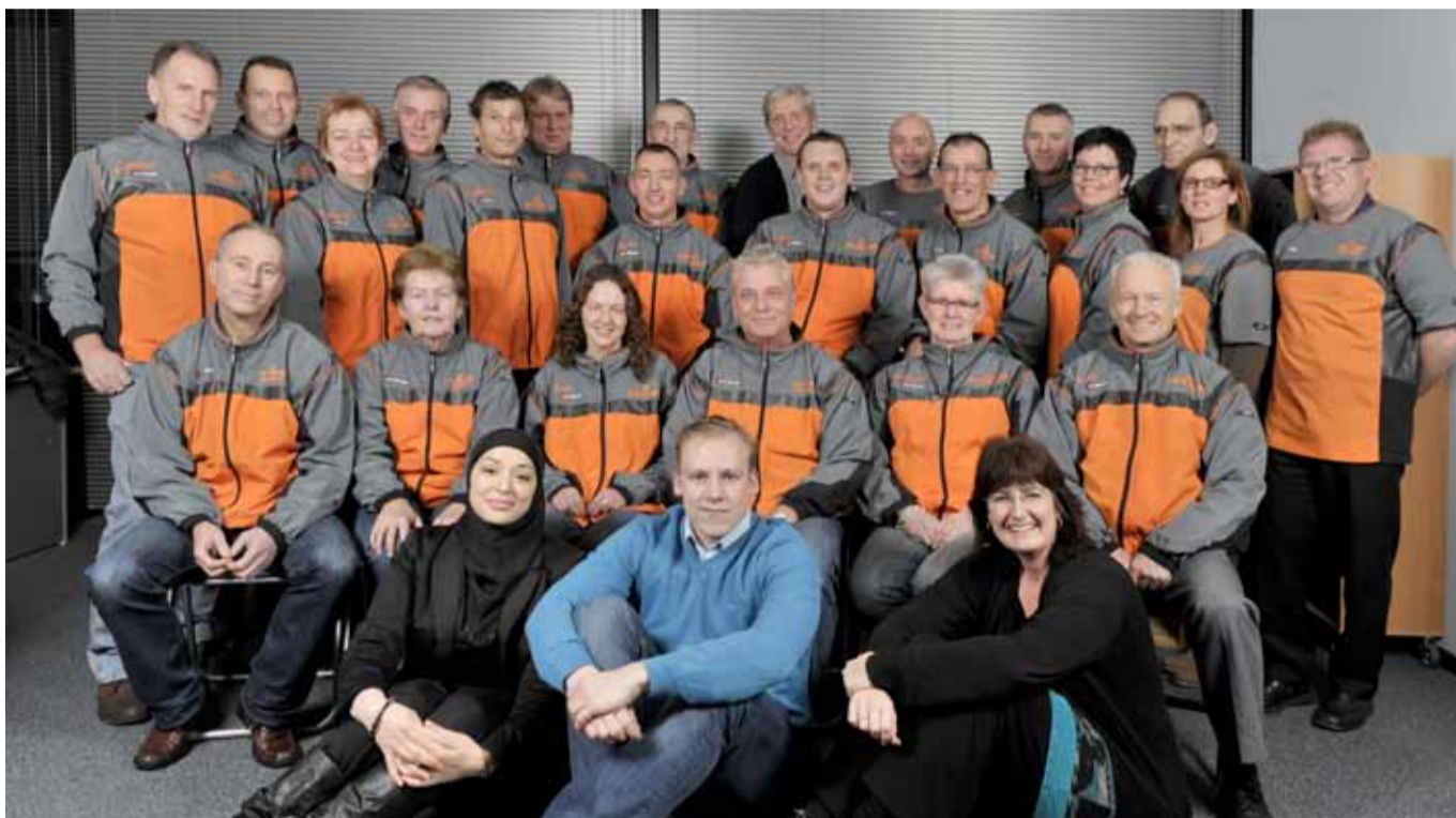
Team Move On communicatie: "De Roparun wordt ook wel "Een avontuur voor het leven" genoemd, een omschrijving die we hierbij graag nog eens willen herhalen. Kijk voor meer informatie bij Ons doel op www.gelukkige klant.nl !"

Nieuw dit jaar is het Family Sports Event. Er is vanaf 12.00 uur een kinderpark (het Geuzenpaleis komt naar Spijkenisse!), indoor adventure (survivalpark) en er zijn dance-clinics en groepsfitness-lessen. Zaterdag 26 maart a.s. is er dus voor het gehele gezin heel veel te beleven in Sportcentrum Halfweg. Kijk voor meer informatie op www.estrnrunners.nl